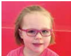
Fien - Maart