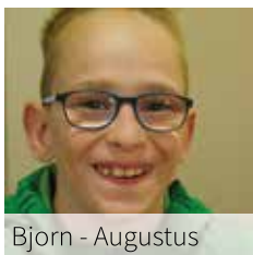
Bjorn - Augustus