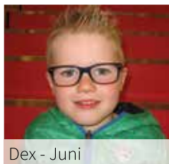
Dex - Juni