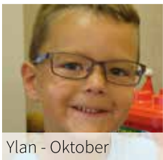
Ylan - Oktober