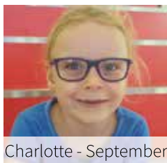
Charlotte - September